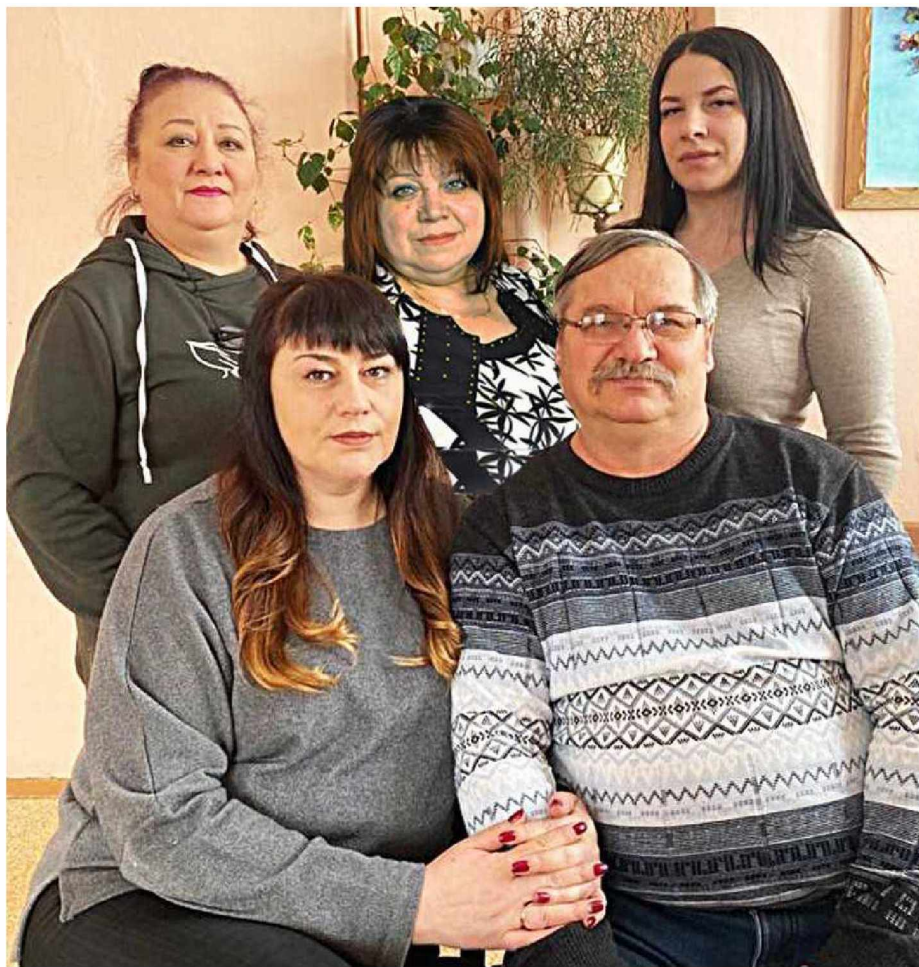
Коллектив Центра культуры п. Оротукан