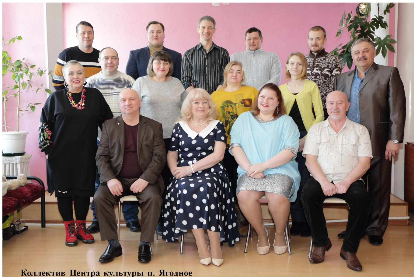
Коллектив Центра культуры п. Ягодное