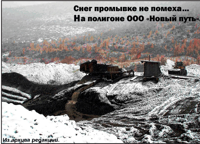
Снег промывке не помеха... На полигоне ООО «Новый путь».

мало! Техника производительная, и работы для неё много. В этом сезоне было вскрыто 850 тысяч кубометров торфов, а промыто примерно 300 тысяч кубов