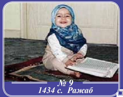
№ 9 1434 с. Ражаб