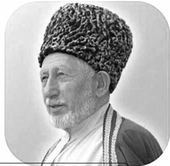
Байбихи цебесеб номералда