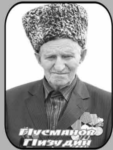
Дивеманчов Гизу дин