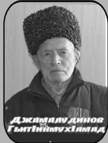
Джамалу динов Гитиймухлимад