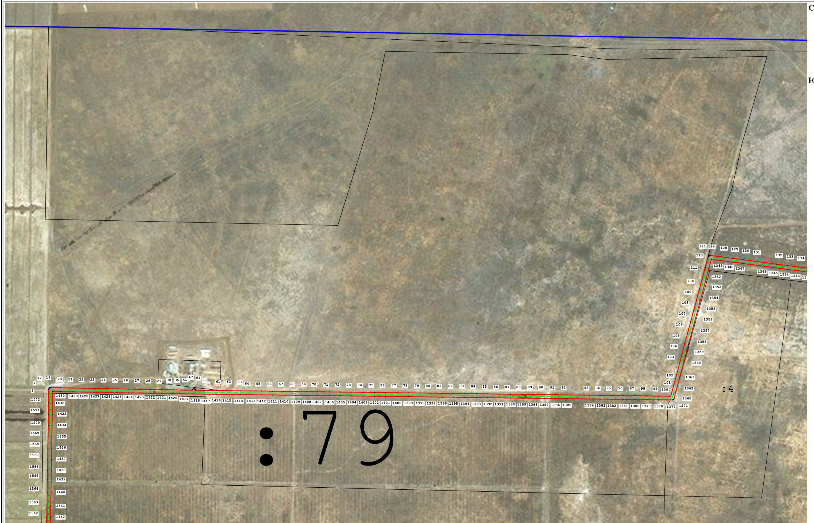
Схема расположения границ публичного сервитута для размещения объекта: ВЛ 10 кВ 1Л-Химик-10 (наименование)