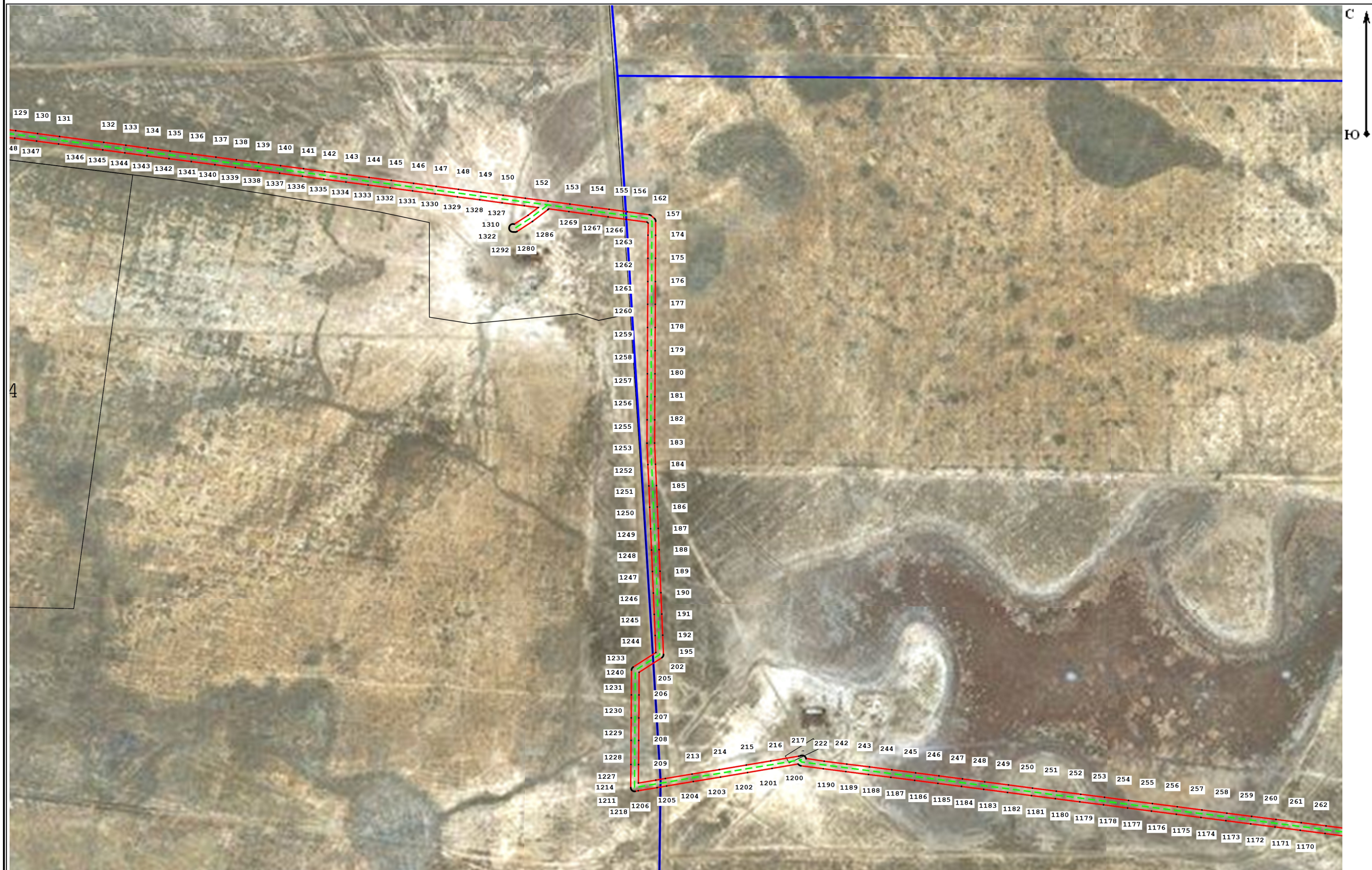
Схема расположения границ публичного сервитута для размещения объекта: ВЛ 10 кВ 1Л-Химик-10 (наименование)