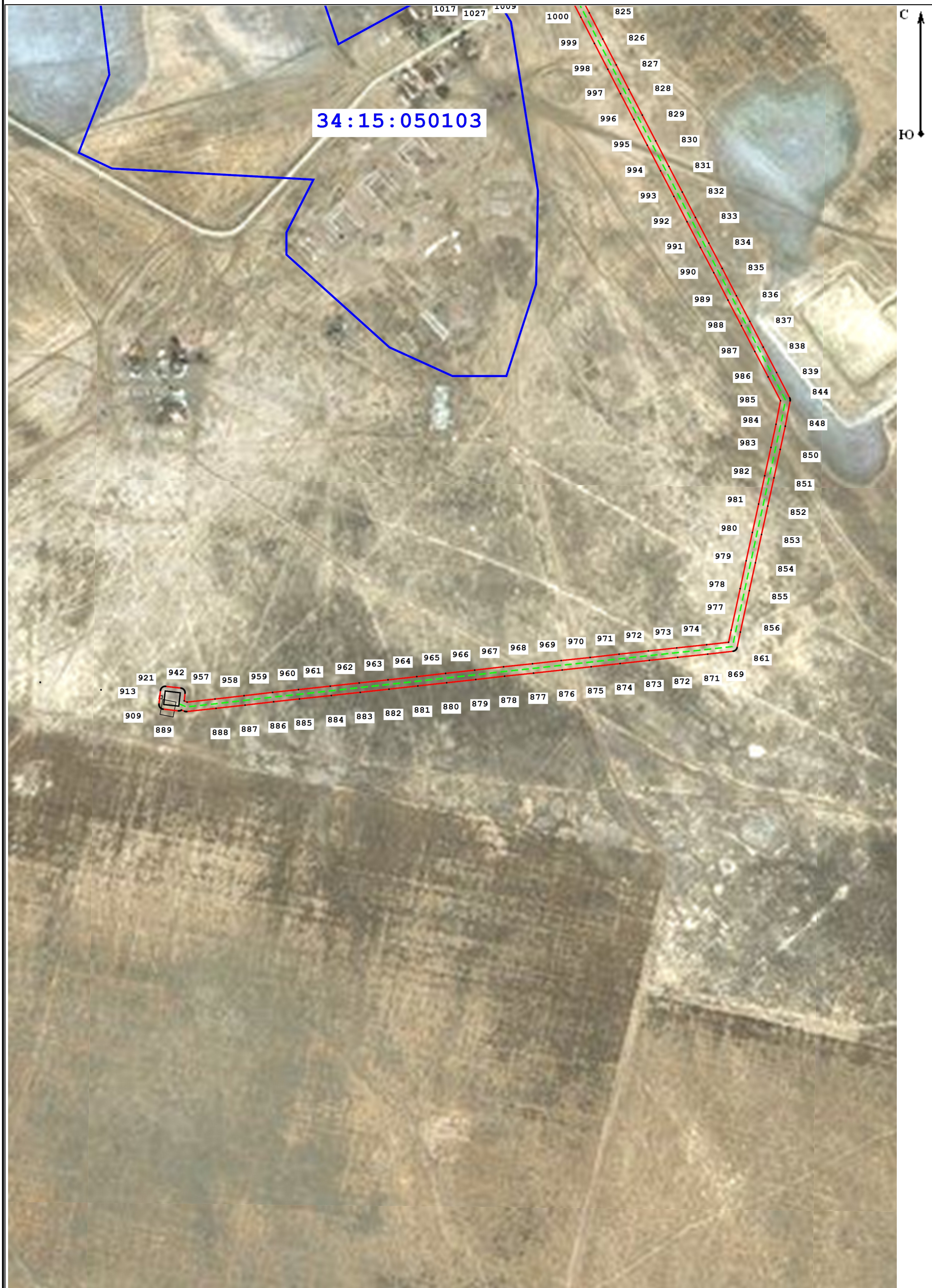
Схема расположения границ публичного сервитута для размещения объекта: ВЛ 10 кВ 1Л-Химик-10 (наименование)