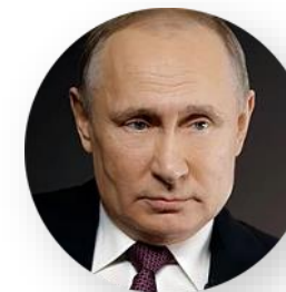
В.В. Путин Президент РФ

“ ...У нас в атомной промышленности мы реально работаем очень хорошо. Мы реально обогнали всех, мы больше всех делаем в мире атомных блоков для электростанций, это никакое не оружие, это высокие технологии... ”