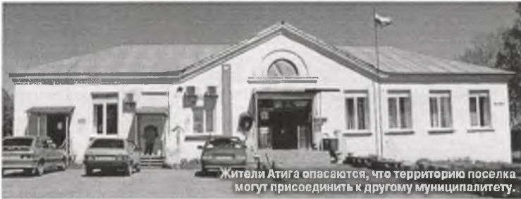
Жители Атига опасаются, что территорию поселка могут присоединить к другому муниципалитету.

по четыре избранных, еще один депутат воздержался. Конкурс был признан несостоявшимся, после чего дума объявила повторный конкурс.