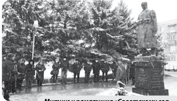
Митинг у памятника «Советскому солдату» на Привокзальной площади.

11 января в Минеральных Водах почтили память освободителей города от немецко-фашистских захватчиков.