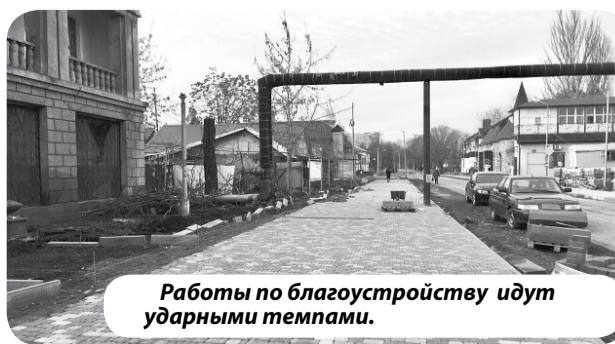
Работы по благоустройству идут ударными темпами.

«Несмотря на праздничные и выходные дни, работы на улице Ленина идут ударными темпами, - отмечает Сергей