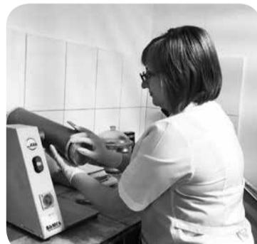
Лаборатория следит за качеством продукции.

В рамках 22-й Российской агропромышленной выставки «ЗОЛОТАЯ ОСЕНЬ -2020» в конкурсе «За производство высококачественных кормов и кормовых добавок» ООО «Минводский комбикормовый завод» награжден серебряной медалью и дипломом за производство стартерного комбикорма для телят Промикз бэби.