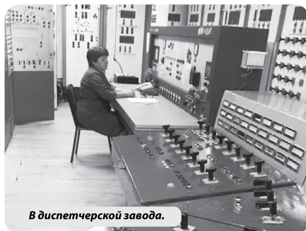
В диспетчерской завода.

компании более 100 наименований разнообразных кормовых продуктов — это и полнораціонные корма, и белково-минерально-витаминные концентраты, и премиксы, и специализированные кормовые добавки для коров, свиней, уток, индейки, кроликов, рыбы и др. Предприятие может накормить любую живность — от теленка до страусенка.