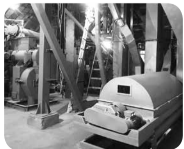
Завод производит корма без ГМО, антибиотиков и гормонов роста.

По итогам 2019 года Минводский комбикормовый завод стал