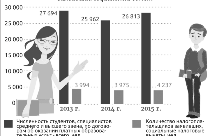
Соотношение: обучающееся лицо – налогоплательщик, заявивший социальный вычет

Коллектив авторов кафедры «Финансы и кредит» ФГБОУ ВО Бурятская ГСХА.