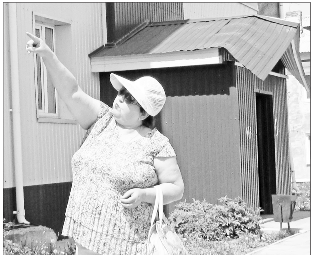
По мнению жильцов, ограждения на крыше не выдерживают никакой критики. По весне они не удержали лавину снега, которая погнула козырёк над подъездом.

Новостройка в Каменске превратилась для жильцов в головную боль.