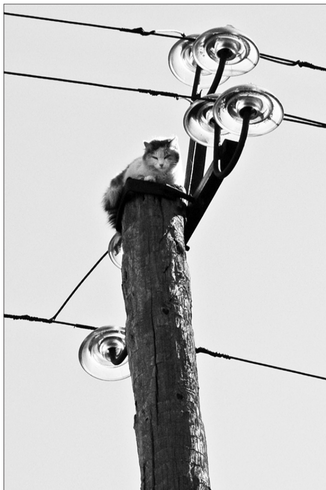
Под напряжением в десять тысяч вольт...

История, о которой мы хотим рассказать, началась с того, что в редакцию газеты «Байкальские огни» обратилась местная жительница, которая сообщила: по улице Юных Коммунаров села Кабанска чей-то кот забрался на столб, а вот спуститься назад духу у него почему-то не хватает. Бедное животное сидит там без воды и еды уже более недели.