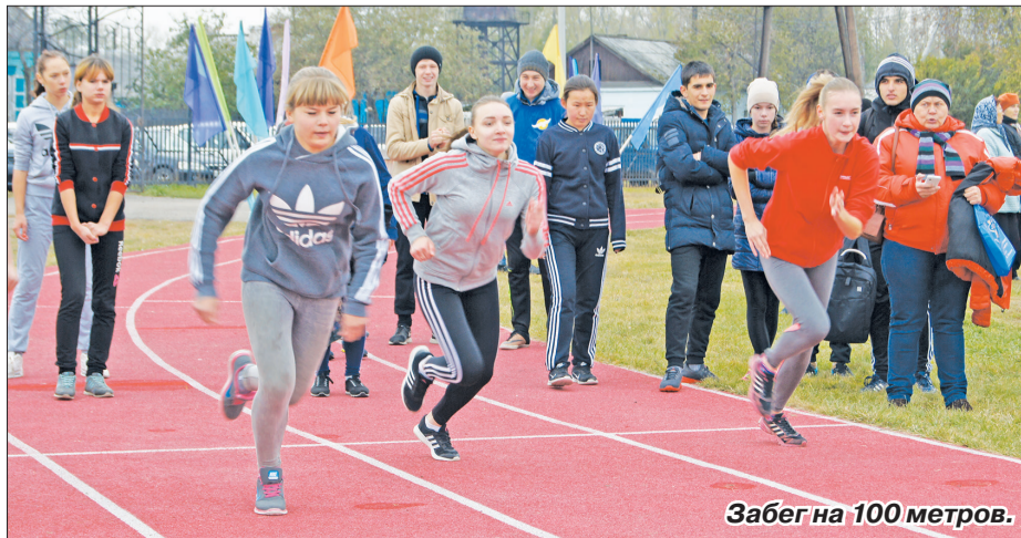
Забег на 100 метров.