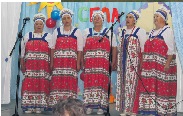
▲ Коллектив Степуринского СДК «Дубравушка»