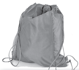
Мешок для сменной обуви от 80 руб.

Альбом для рисования от 8 руб., Пластилин от 35 руб., Цветная бумага от 10 руб., Клей от 12 руб., Кисточка от 12 руб., Ножницы от 25 руб., Технический конструктор от 220 руб.