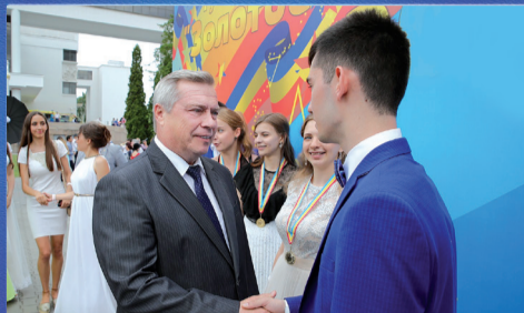
НОВОСТИ ОБЛАСТИ В добрый путь