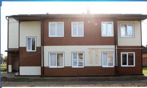
О ВАЖНОМ Квартирный вопрос