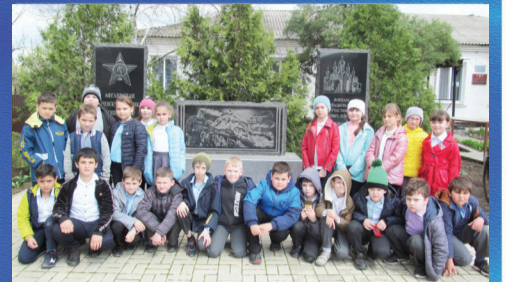
ОБРАЗОВАНИЕ Рядом с настоящим - прошлое