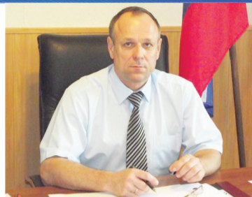
СОЦИУМ Работа на результат