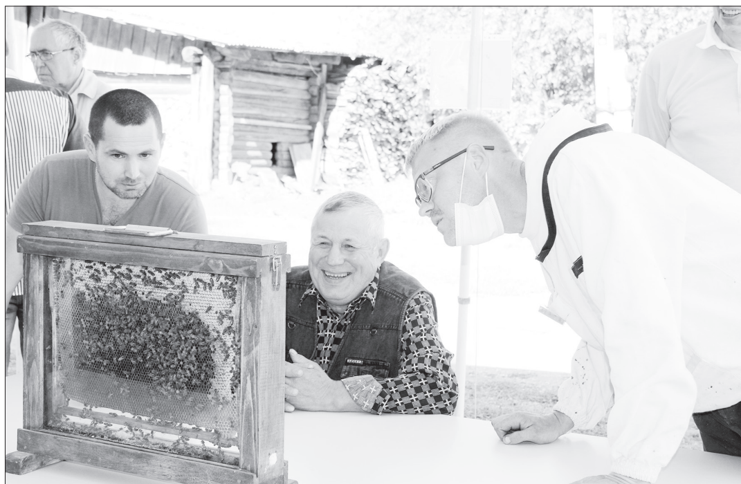
Наблюдательный стеклянный улей или мини-пасека демонстрирует жизнь и работу пчёл. В образовательных программах и стажировках оборудование используют как наглядное пособие.

Предприимчивые люди на сельских просторах не перевелись, поэтому им и карты в руки. Фермерам, например, производство сельхозпродукции предлагают дополнить услугами и создать турпродукт с условным названием «Дает корова молоко». Современные дети буренок видят только в мультиках и книжках, а уж как они дают молоко, - вряд ли знают. Им любопытно будет не только