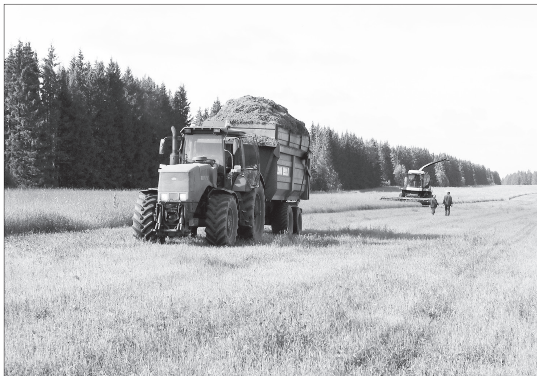
Уборка кормов в ООО СП «Правда».

По данным Пермского центра по гидрометеорологии и мониторингу окружающей среды, в период с мая по