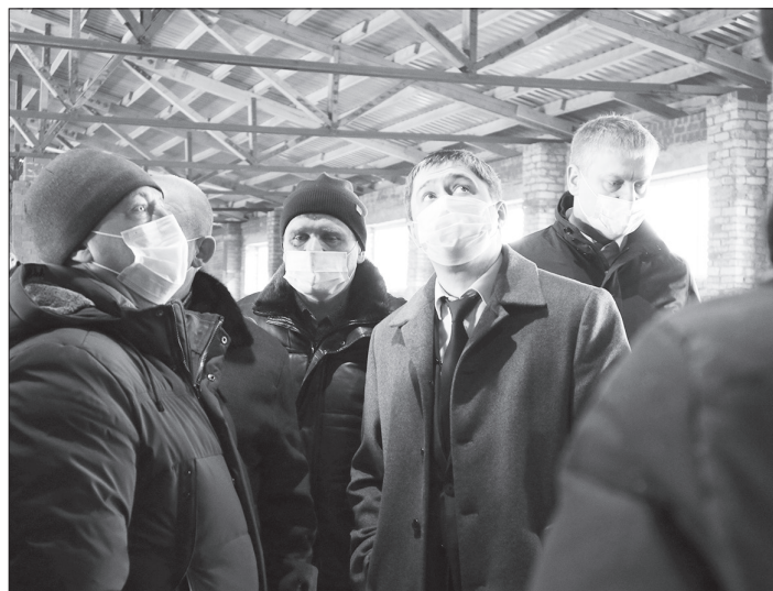
«Союз-Агро» реализует новый инвестиционный проект общей стоимостью около 25 млн рублей. Из семян рапса предприятие производит масло и жмых.