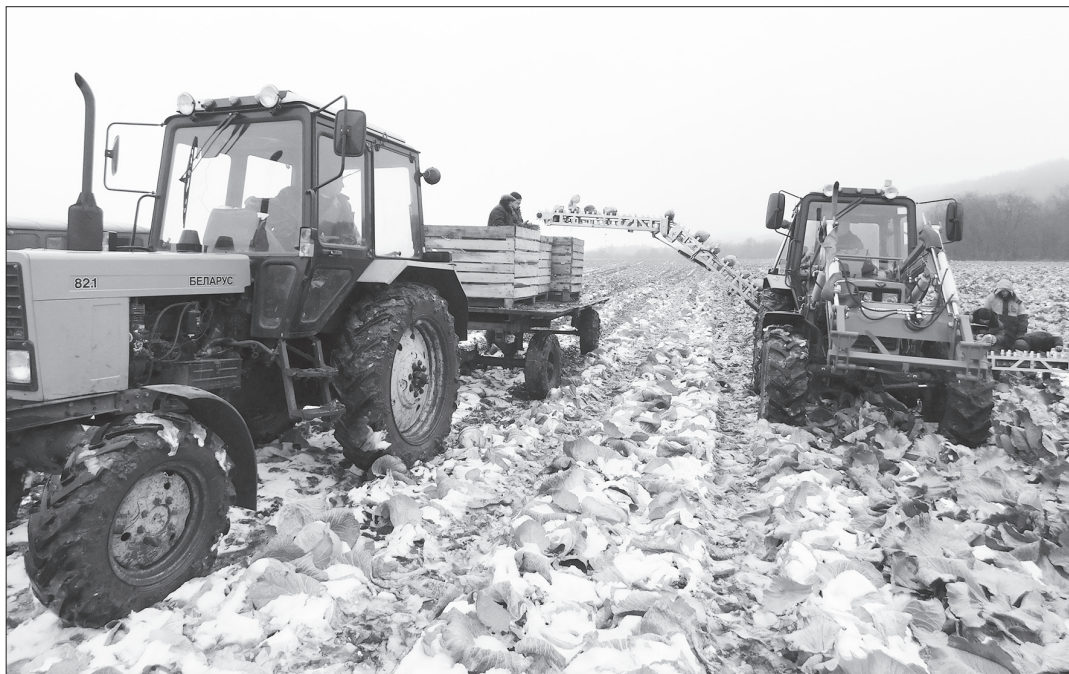
Мы приехали в хозяйство Ралика Кутдусова в Карьёво в последний день уборки, 22 октября. Работники срезают кочаны краснокочанной капусты сразу на шести рядах и кладут на транспортёрную ленту. Оттуда овощи попадают в кузов трактора.

Наши предприятия и КФХ получают поддержку более чем по 10 направлениям. Общая сумма господдержки из федерального и регионального бюджетов составила более 56 миллионов рублей. В том числе по растениеводству – более 15 млн рублей. По животноводству более 23,9 млн рублей. Сельхозкооперативы получили на развитие гранты 17,1 млн рублей.