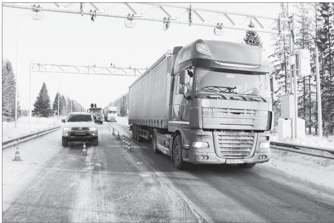
Ежеквартально весы проходят контрольную проверку. Сначала грузовик взвешивают мобильными весами, после на стационарных весах. Специалисты отмечают, что показатели совпадают, погрешность в пределах нормы.

Предложения принимает и редакция газеты «Верный путь». Звоните в редакцию, пишите на электронную почту, в группе газеты в социальных сетях, присылайте СМС-сообщения на номер 8-904-84-53-633.