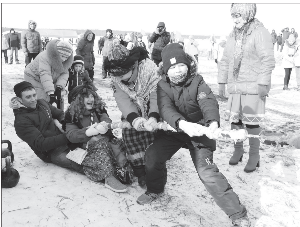
Масленичные гуляния не обошлись без уличных забав. Ординцы перетягивали канат, бились мешками и поднимали гири.

Трудно такую красавицу стороной обойти, – говорит Вера Юшкова. – Вон она какая, круглолицая и румяная, как блин.