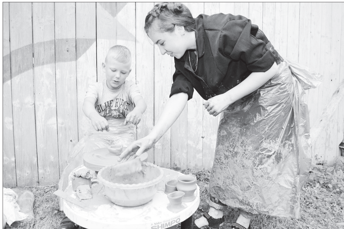
Мастер-класс по гончарному мастерству на «Селенитовой шкатулке» проводили студентки Кунгурского художественно-промышленного колледжа. Дети своими руками пытались сделать глиняные солонки, чашечки и кружки.

В Ординском районе прошли два фестиваля народных промыслов и юбилей комбината «Уральский камнерез». Они объединили мастеров разных поколений. Читайте на 4, 9 стр.