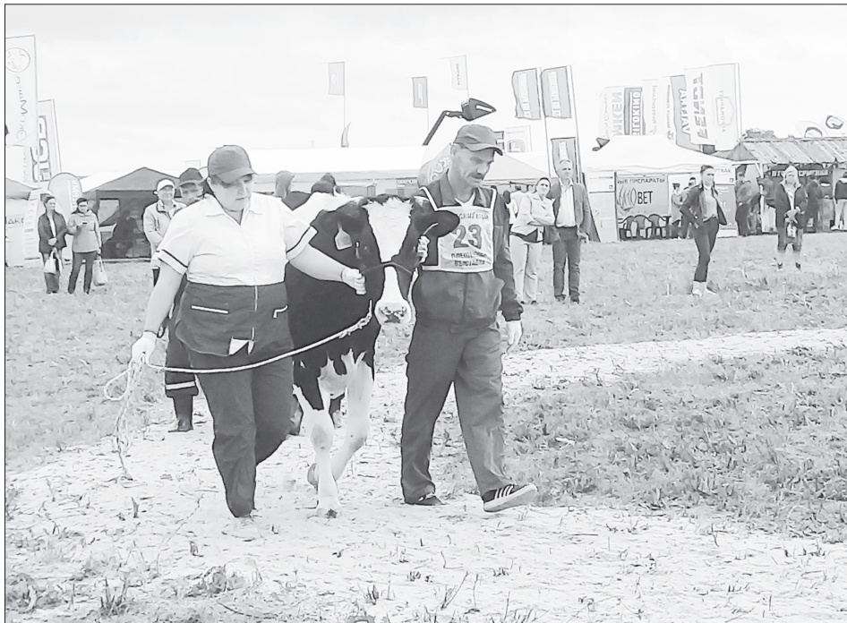
Корова Шайба из сельхозпредприятия «Правда» стала серебряным призером выставки на форуме «Прикамский АгроФест» среди коров первого отела.