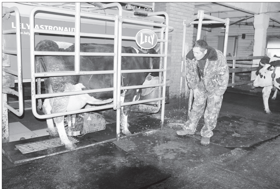
Участие человека в дойке коровы минимально. Доильный робот сделает все сам, помассирует и помое вымя, подоит и соберет анализы.

Если время подошло, из-под «полы» робота выезжает кор-