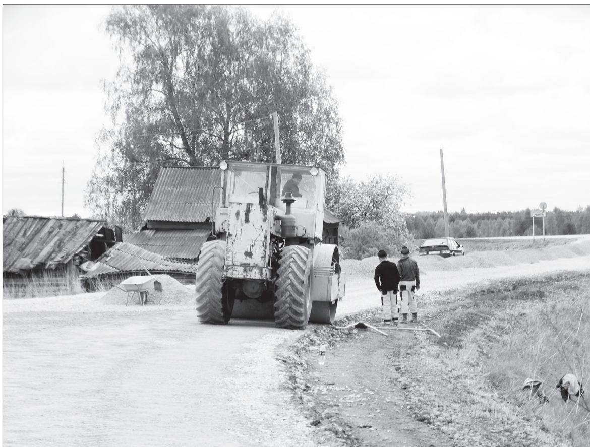
На фотографии - разгар дорожных работ около деревни Губаны, снимок сделан в начале июня. Сейчас на этом участке ехать на автомобиле комфортно и безопасно.