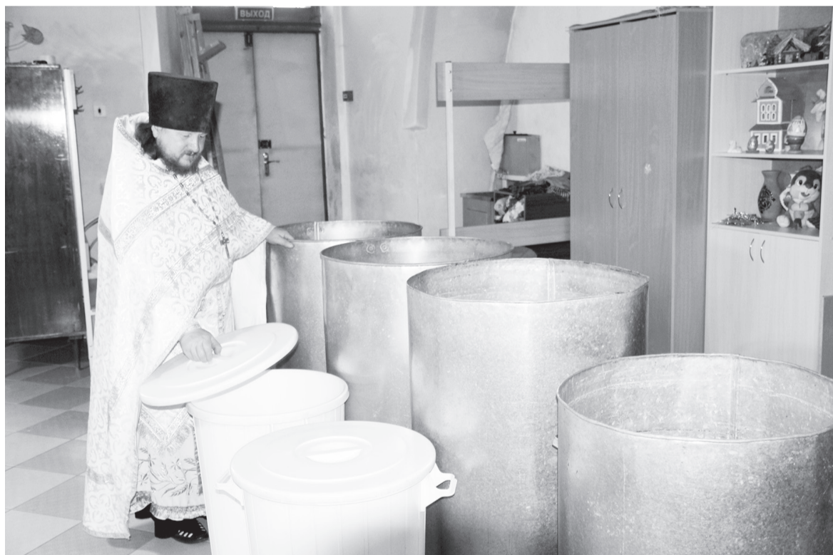
Емкости для освящения в Пророко-Илиинском храме уже приготовлены. Накануне праздника их перенесут в храм и наполнят водой.