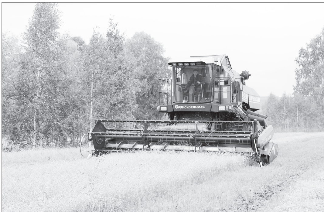
В ООО СП «Правда» идёт уборка зерновых. Такой картиной любоваться не устанешь.