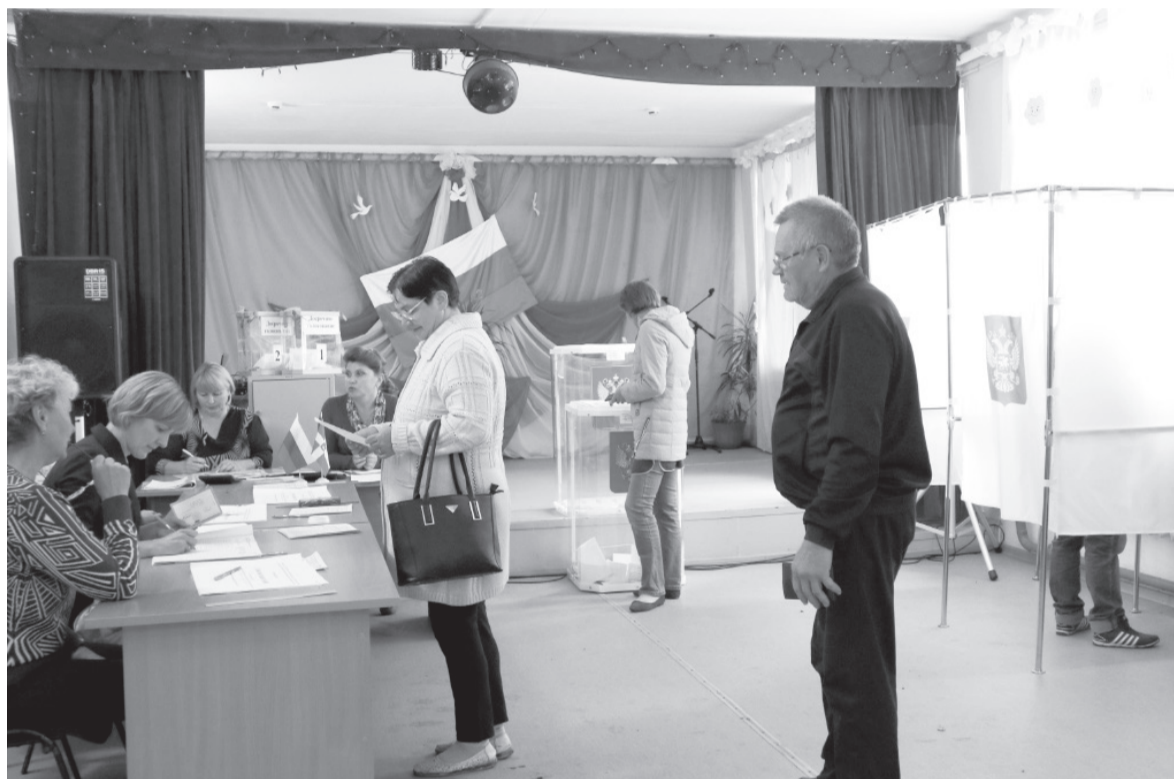
Известно, что с обеда и до 18 часов «кривая» посещений избирательных участков идет вниз. Но в Красном Ясыле в 13:30 еще было оживленно.

Как Ординский район выбирал депутатов советов сельских поселений