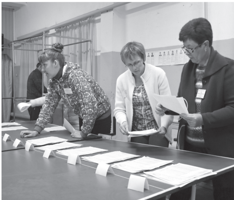
В 20:00 избирательные участки закрылись. Комиссия в Верх-Кунгуре, как и остальные в районе, приступила к подсчету голосов.